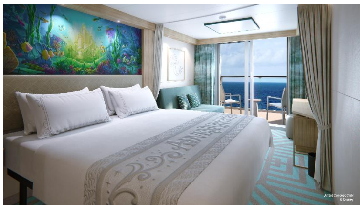
Verandah (From 243 Sq ft.)