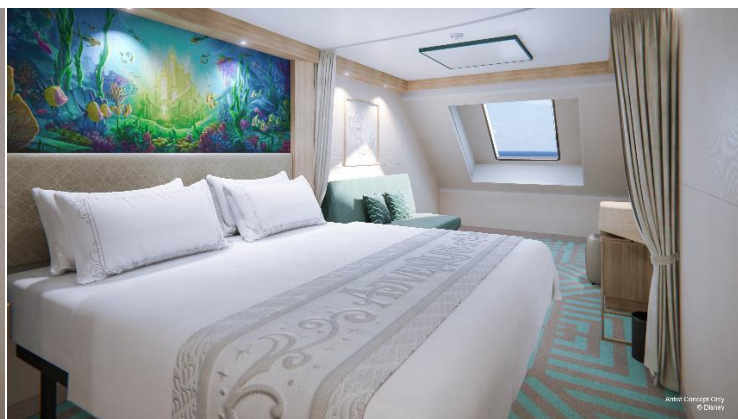
Oceanview (From 145 Sq ft.)