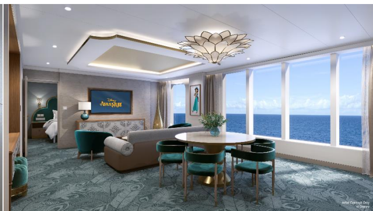
Concierge (From 420 Sq. ft.)