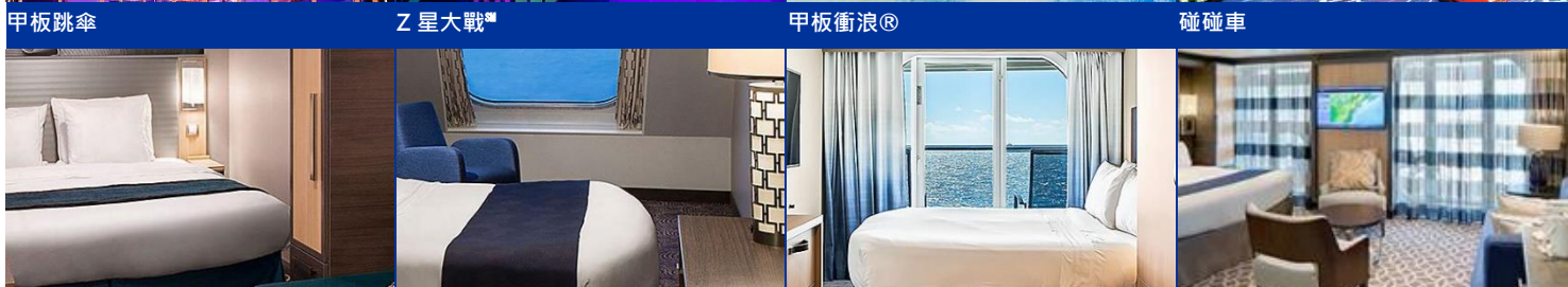
內艙房：約 166 平方呎 海景房：約 182 平方呎 海景露台房：連露台約 253 平方呎 標準套房：連露台約 331 平方呎