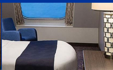
海景房：約 182 平方呎