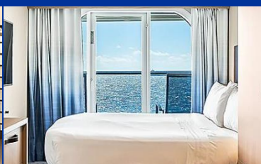
海景露台房：連露台約 253 平方呎