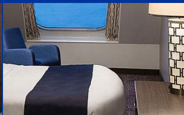
海景房：約 182 平方呎