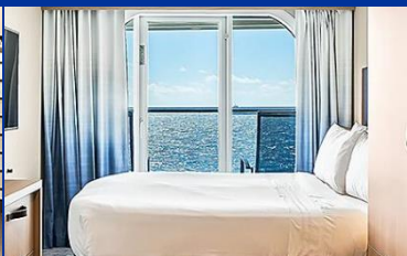
海景露台房：連露台約 253 平方呎