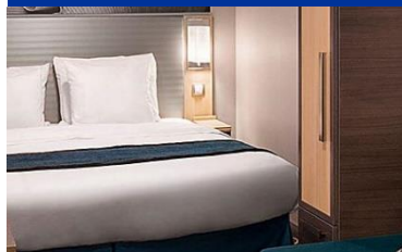
內艙房：約 166 平方呎