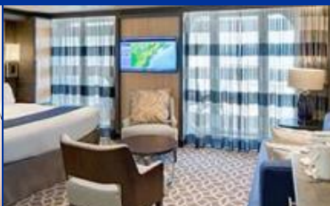
標準套房：連露台約 331 平方呎